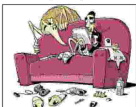
NON SOLO ARMADILLO Un disegno della mostra su Zerocalcare