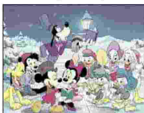
COMPLEANNO IN FAMIGLIA Trionfo Disney con i 90 anni di Topolino