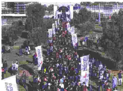
Le migliaia di appassionati che affollano l'ingresso di Fiera di Roma

Da oggi a domenica, alla Fiera di Roma, la 24ª edizione di Romics , il Festival internazionale del fumetto, cinema, animazione e games