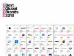
Best Global Brands 2018 – Le aziende di tecnologia al top della classifica