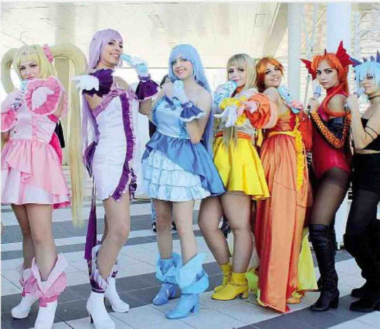
Costumi Un gruppo di cosplay al festival internazionale «Romics» alla Fiera di Roma dal 4 fino al 7 aprile