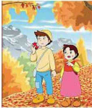
Cartone animato «Heidi»