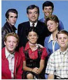
Attori Il cast di «Happy Days»